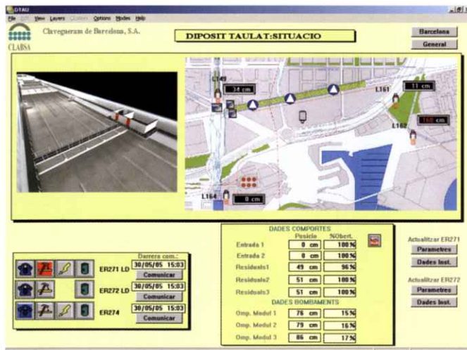
Pantalla principal de Scada del depósito de Taulat

PILAR GONZALO, BARCELONA El Plan Especial del Alcantarillado de Barcelona (PECLAB 1997-2007) contempla la construcción de depósitos de retención de aguas pluviales, los cuales permiten un desguace controlado del agua, evitando posibles desbordamientos y disminuyendo el vertido directo al mar o a los ríos.